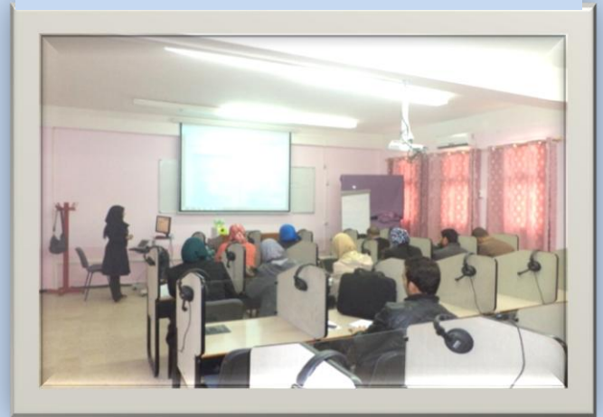
Labo de langue